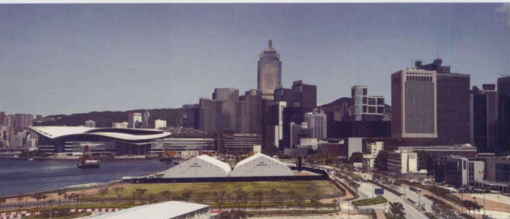
Art Central成為香港 首個衛星藝術展。